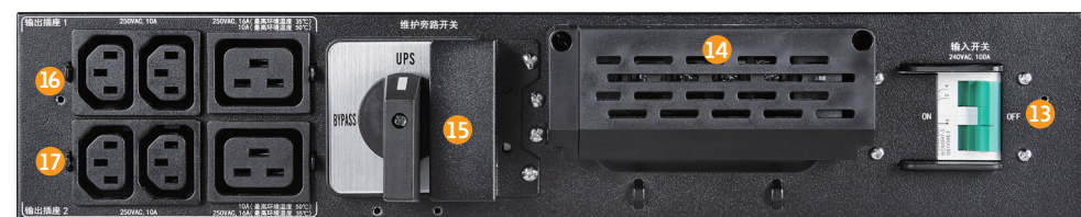
6-10K 手动 维修旁路及智 能配电单元