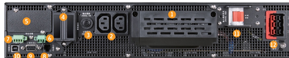
PT6K(S)/ PT10K(S) 后面板接口